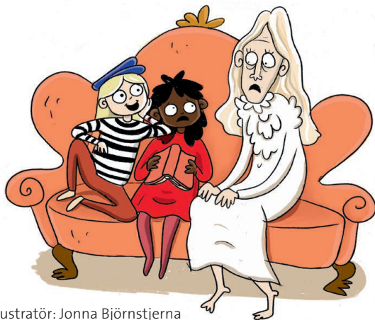
Illustratör: Jonna Björnstjerna

En lättläst bok ska helst börja pangbom! Tempot ska vara högt med mycket cliffhangers. Bilderna hjälper också till att öka lästempot eftersom bilder ofta går snabbare att avkoda än text. I rikt illustrerade böcker som t.ex. grafiska romaner är bläddringsfrekvensen ofta högre. Detta är viktigt eftersom högt lästempo höjer självförtroendet och ökar läsmotivationen.